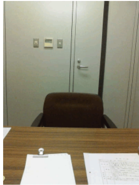
松原市役所と相談室。多数の無料相談会場の中のひとつです。